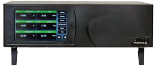
Bench Mount Version

Der moisture.IQ kann über seine Eingänge mit den Panametrics MIS- und den M-Serie Sensoren verbunden werden, welche auch für die Moisture Image Series und Moisture Monitor Series 3 Analysatoren verfügbar waren. MIS Sensoren (MISP und MISP2) ermöglichen die integrierte Messung von Feuchte, Temperatur und Druck. Die Kalibrierdaten dieser Sensoren sind digital gespeichert. Sobald der Sensor mit dem Analysator verbunden wird, werden die Kalibrierdaten zum moisture.IQ heruntergeladen.